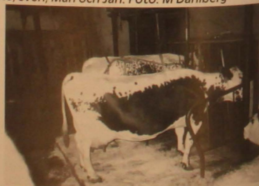
Trevlig STN ko hos Ola Riste.