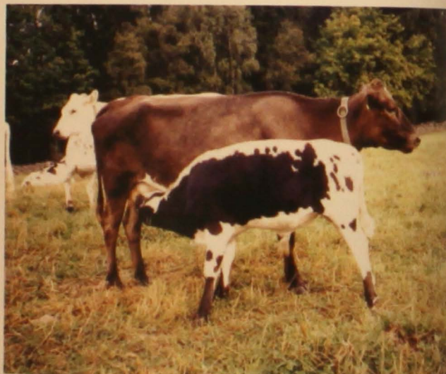
Månsken, f. 1999