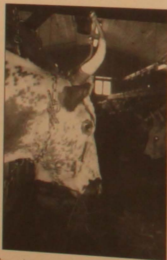
Underbara horn på Telemarksko.

På söndag förmiddag blev det studiebesök. Först hos Ola Riste som har STN, Sör & Vestlandsfe och Fjordfe. Därefter tog vi farväl av våra Norska ko vänner och började dra oss mot Sverige.